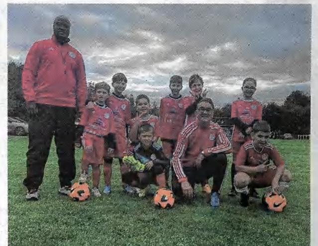
Le stage organisé par l'US Auffay aura lieu du 29 au 31 octobre.